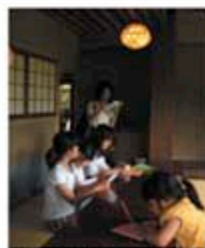
昨年のワークショップ風景

茶室は--見いちいさな空間ですが、まわりの自然と一体となっ て豊かな広がりをもつよう考えられています。普段なかなか見 られない茶室を探検し、自然と住まいの関わりを学びます。後 半は、お茶会を開催! 抹茶とお菓子をいただきながら、茶の ところを学びます。